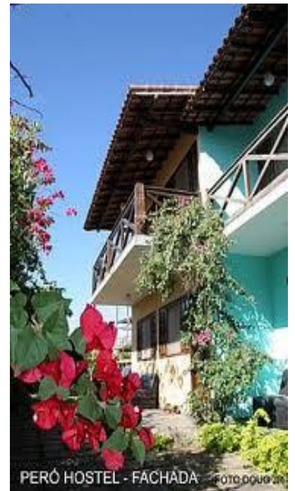
PERÓ HOSTEL - FACHADA

Observações: Hotéis sugerindo-os para hospedagem da Família Rotária sem qualquer responsabilidade para a Secretaria quanto às reservas e pagamento das diárias.