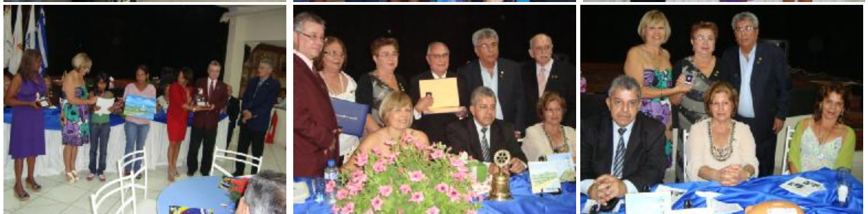
Rotary Club de Maricá - Visita Oficial do Casal Governador Entrega de Óculos - Premiações - Reconhecimentos Paul Harris - Festiva