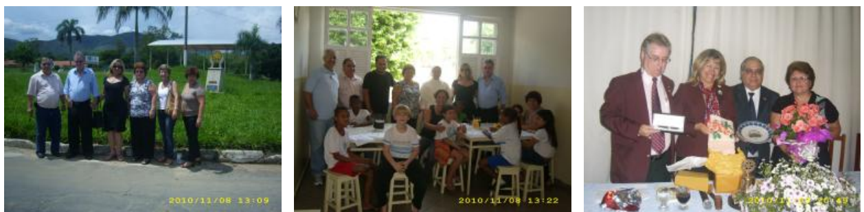
Rotary Club de Bom Jesus do Itabapoana - Visita do Casal Governador