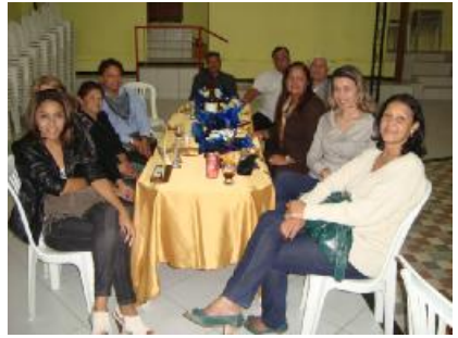
Rotary Club de Conceição de Macabú – Visita Oficial do Casal Governador Mesa Presidencial – Premiação com lindo troféu – Festiva