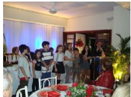
Novas Gerações – Intercambiários em visitas: Magé e Guapimirim Jovens empossados no Rotaract Club e Interact Club de Niterói Norte