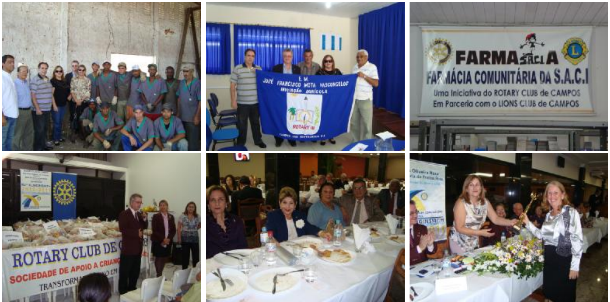
Rotary Club de Campos - Reciclando - Escola Rotary Farmácia Comunitária - Cestas Básicas - Visita do Casal Governador