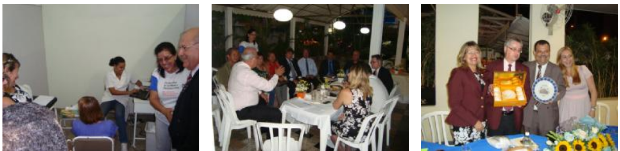
Rotary Club de São Gonçalo Paraíso - Visita Oficial do Casal Governador