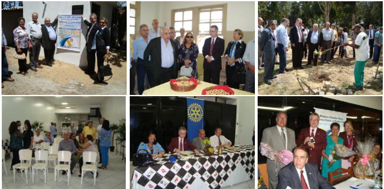
Rotary Club de Campos São Salvador – Visita Oficial do Casal Governador Homenagens e entrega de Gerador – Plantio de Árvores – Festiva