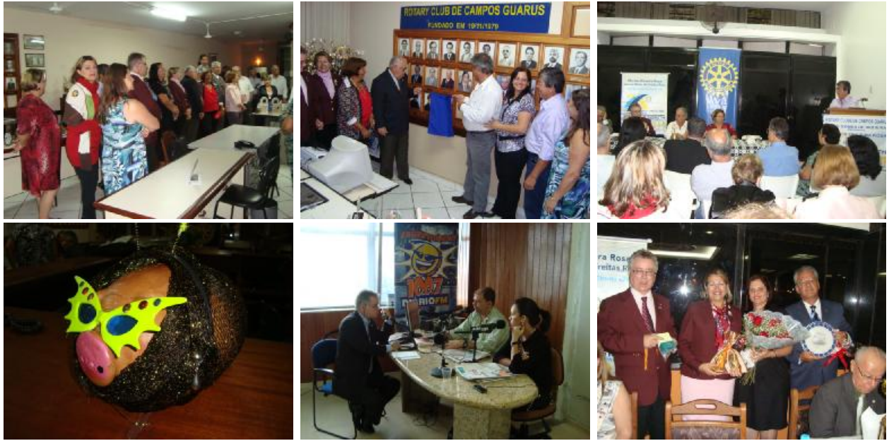
Rotary Club de Campos Guarús – Visita Oficial do Casal Governador Placa past-president – Assembléia – Genoveva estilizada – Rádio local – Festiva