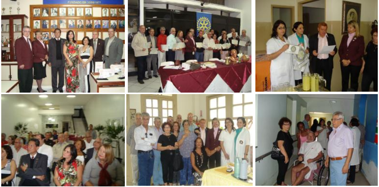
Rotary Club de Campos Goitacazes - Visita Oficial do Casal Governador Placa past-president - Assembléia - Serviços à Comunidade