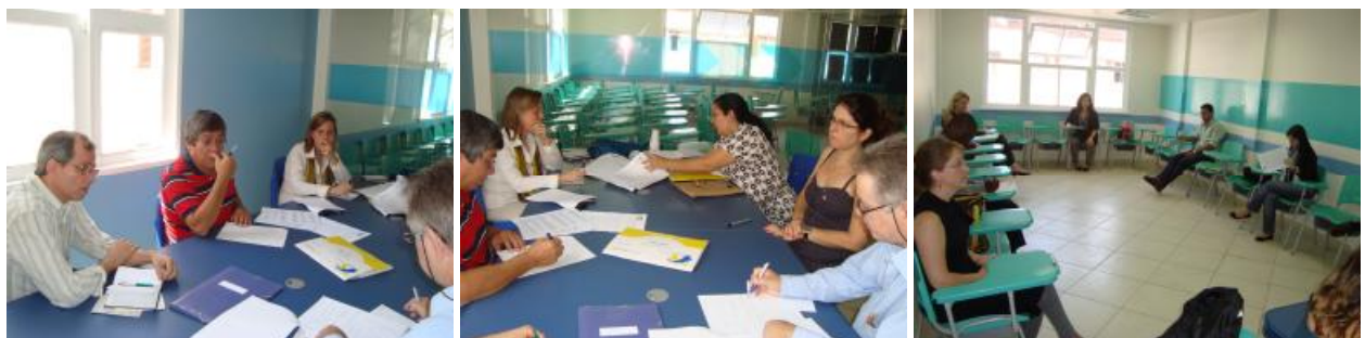
Equipe de IGE – Intercâmbio de Grupo de Estudos Reunião para seleção de Membros – Membros concentrados para provas