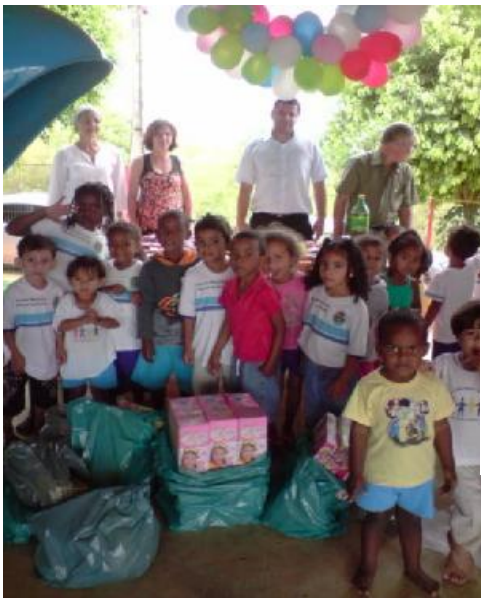
O Rotary Club de Bom Jesus do Itabapoana homenageia as crianças no seu dia.