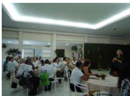
O RC de Maricá realizou o "Projeto dos Experientes" com o apoio do SESI e SENAI.

Mas quando alguém se levanta muitos se levantam também.