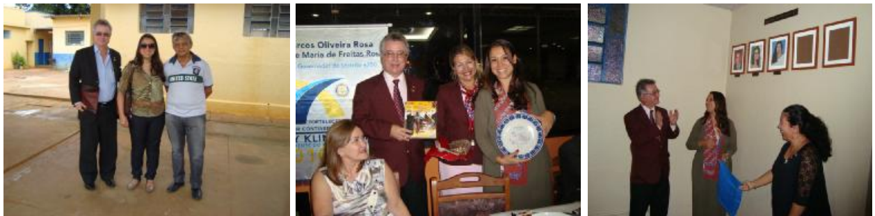
Rotary Club de Campos dos Goytacazes Planície - Visita do Casal Governador Alfabetização de Adultos - Serviços às Comunidades - Placa past-president