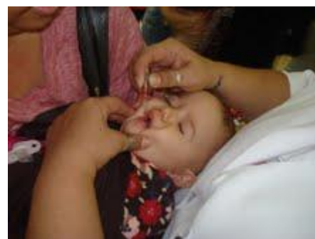
O RC de Campos Goitacazes, com o apoio da Secretaria Municipal de Saúde, vacinou 355 crianças.