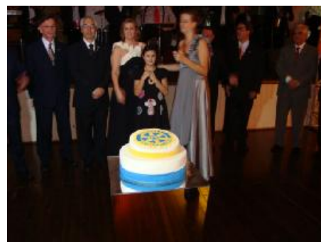
Rotary Club de Nova Friburgo - festividades de aniversário de 60 anos de sucesso realizado em 26 de novembro