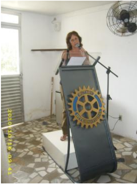
Seminário Regional da Fundação Rotária realizado em Cabo Frio - 16 de outubro