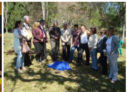
Rotary Club de Nova Friburgo Suspira - Visita Oficial do Casal Governador Assembléia, Festiva e Plantio de Árvores com os cinco clubes da cidade