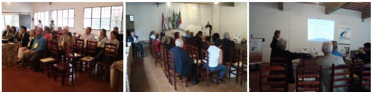
Seminário Regional de Fundação Rotária – Região Sul Rio Bonito – realizado em 09 de outubro de 2010