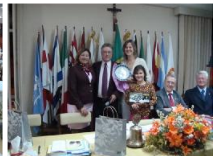
Rotary Club de Nova Friburgo - Visita Oficial do Casal Governador Pestalozzi, Assembléia e Festiva