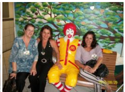
Rotary Club de Itaboraí em atividade Festiva para homenagens e participando do Mc Dia Feliz