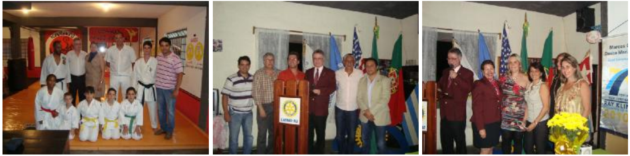
Rotary Club de Carmo – Visita Oficial do Casal Governador Projetos e parcerias do clube e homenagens na Festiva