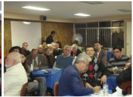
Rotary Club de Nova Friburgo Caledônia - Visita Oficial do Casal Governador Projeto Banco de Leite Humano e fotos da Festiva