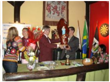
Rotary Club de Nova Friburgo Mury - Visita Oficial do Casal Governador Conhecendo os Projetos do Clube, Assembléia e Festiva