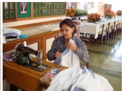
Casa da Amizade de Nova Friburgo - Visita do Casal Governador Senhoras em atividade - confecção dos enxovais para mães gestantes