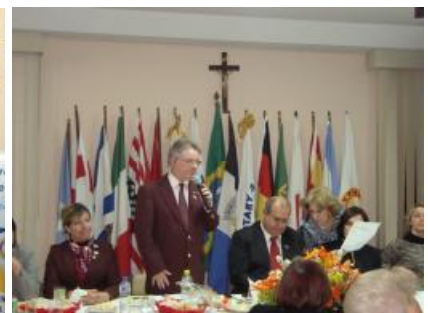
Rotary Club de Nova Friburgo Imperador - Visita Oficial do Casal Governador Projeto Farmácia Comunitária, Banco de Perucas e Festiva