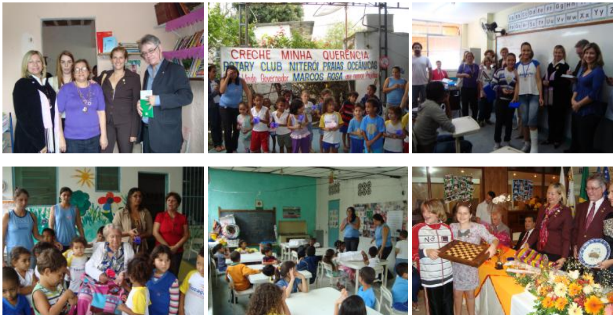
Rotary Club de Niterói Praias Oceânicas – Visita Oficial do Casal Governador Conhecendo os Projetos do clube e Festiva