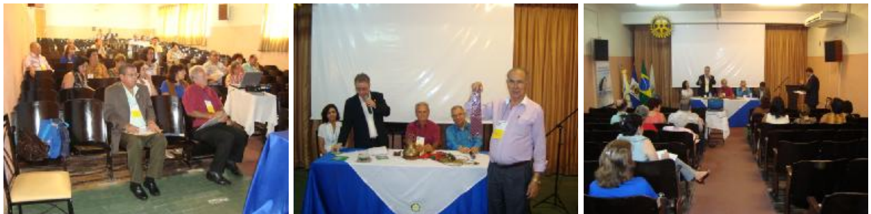
Seminário Regional de Projetos e de Serviços Profissionais Região Norte e Noroeste – Itaperuna – realizado em 18 de setembro de 2010