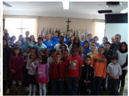
Rotary Club de Nova Friburgo - Projeto de Sucesso De Olho no Futuro - entrega de óculos realizada em 25 de setembro de 2010